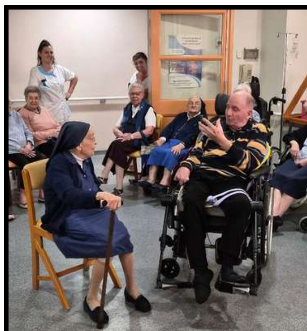
Atelier improvisation avec les résident.e.s de l'EHPAD de Montolieu le 19 septembre