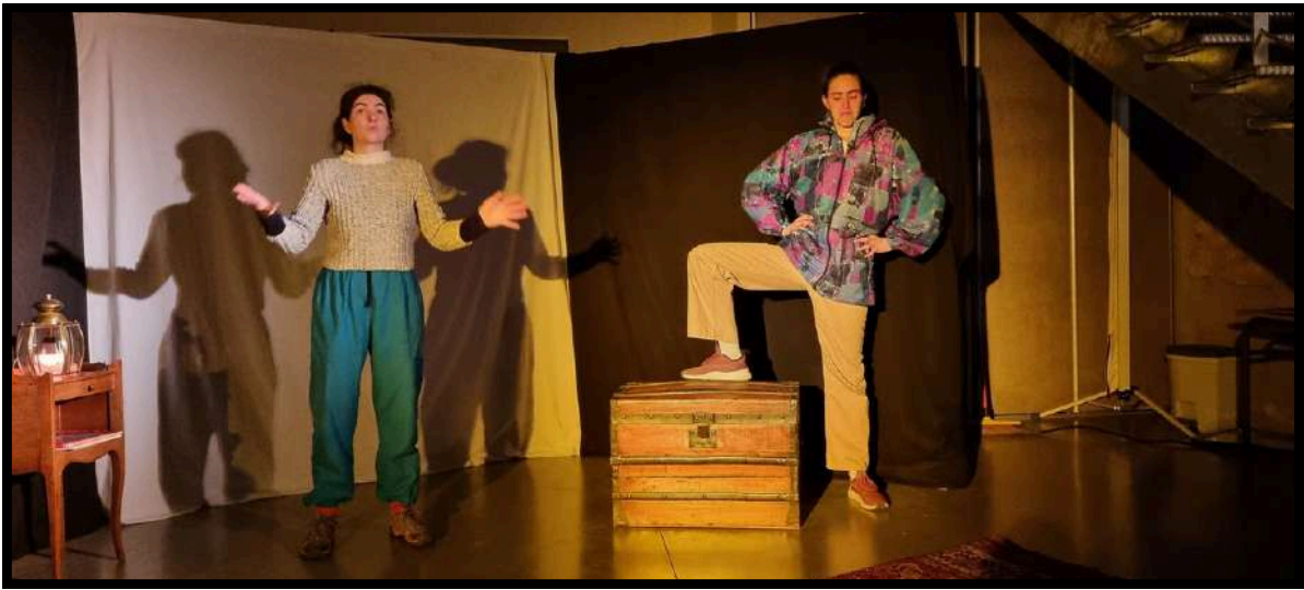
Grésilhette et la Salimonde en résidence au domaine de Villarzens en janvier 2025