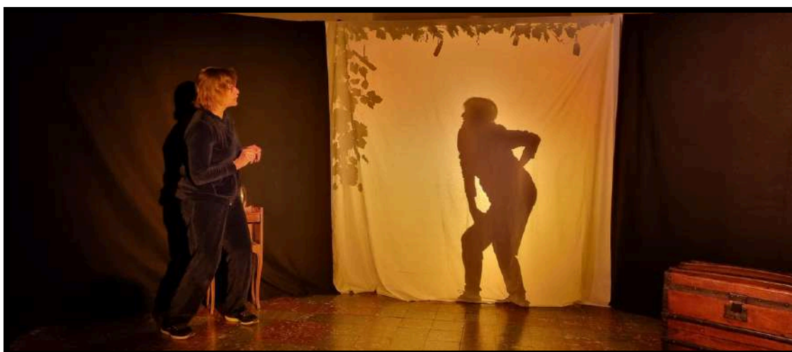
Atelier Ombres en partenariat avec le BDBA de Moussoulens, le 2 mars