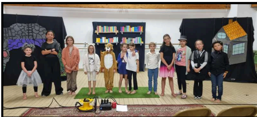
La Révolte des Lou.louves, spectacle de fin d'année de la classe de théâtre de Moussoulens, le 18 juin