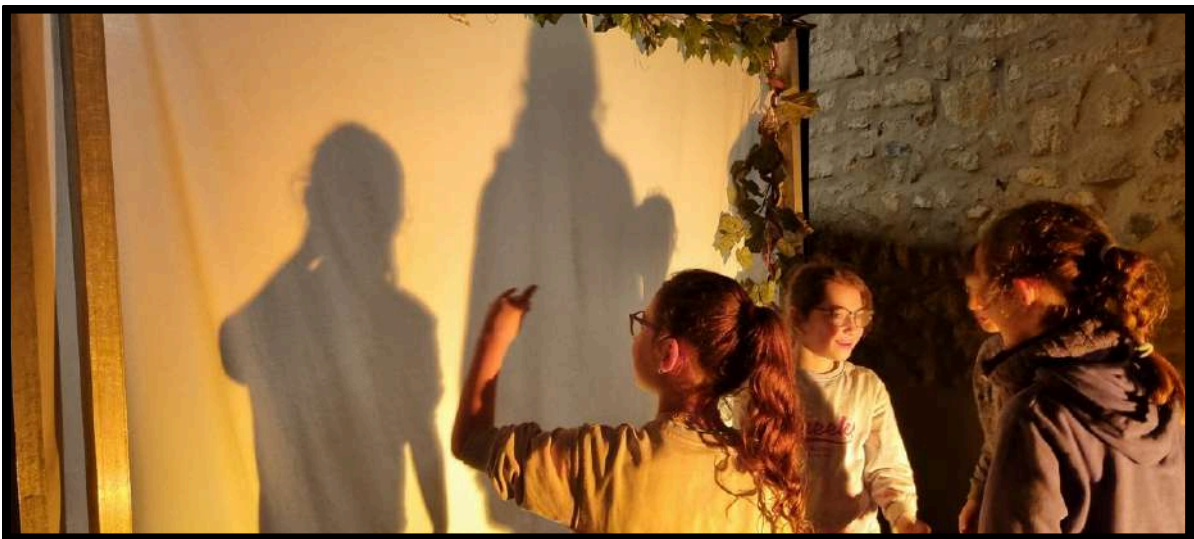
Grésilhette et la Salimonde à Roquefort-des-Corbières (11) le 21 mars 2025